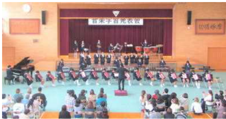
《写真は6年生の合奏》

10月27日(金)、「みんなのメロディー かがやく音色 一人一人の心にとどけ」のスローガンのもと、今年度の音楽学習発表会が実施されました。運動会同様、今年度は入場者の制限を廃し、地域のみなさまにも来校いただいで音楽学習発表会となりました。閉会の言葉で、代表の6年生児童が申ししていたとおり、子どもたちは練習の成果をしっかりと発揮してくれました。暑くもなく寒くもない穏やかな秋の半日、子どもたちの演奏を楽しんでいただけたことと存じます。素晴らしい音楽学習発表会ができましたこと、心より感謝申し上げます。