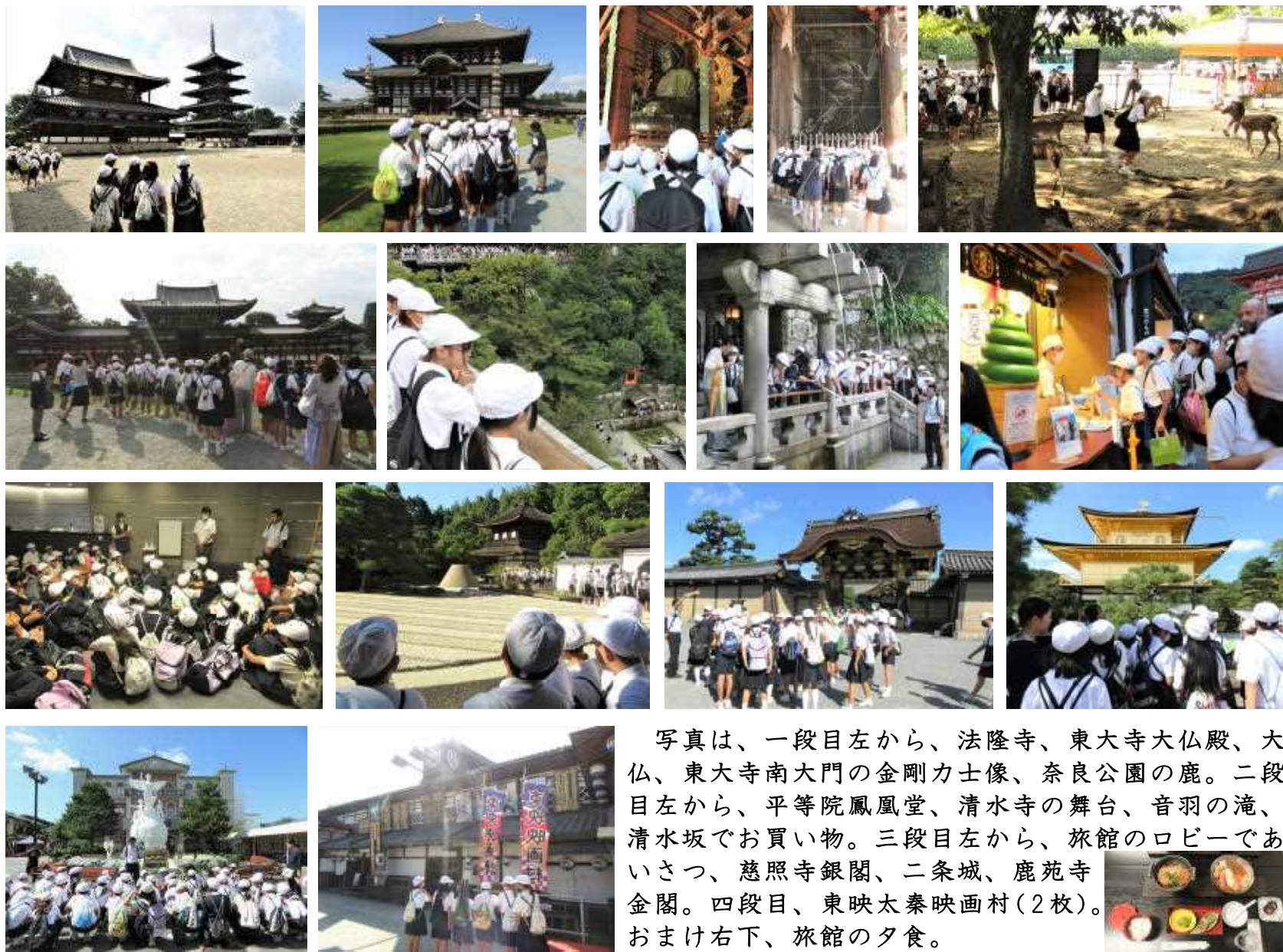
写真は、一段目左から、法隆寺、東大寺大仏殿、大仏、東大寺南大門の金剛力士像、奈良公園の鹿。二段目左から、平等院鳳凰堂、清水寺の舞台、音羽の滝、清水坂でお買い物。三段目左から、旅館のロビーであいさつ、慈照寺銀閣、二条城、鹿苑寺金閣。四段目、東映太秦映画村(2枚)。おまけ右下、旅館の夕食。

9月28日(木)・29日(金)、6年生47名は奈良・京都方面へ、1泊2日で修学旅行に行ってきました。実際に、社会科で学んだ歴史的建造物や文化遺産を見たり可能な範囲で触れたりして、教科書の写真からだけでは得られない感動を味わってきました。どこも外国人観光客や他校の修学旅行生でいっぱい、さらに2日とも暑い中でしたが、みな元気に、楽しい思い出をたくさんつくることができました。